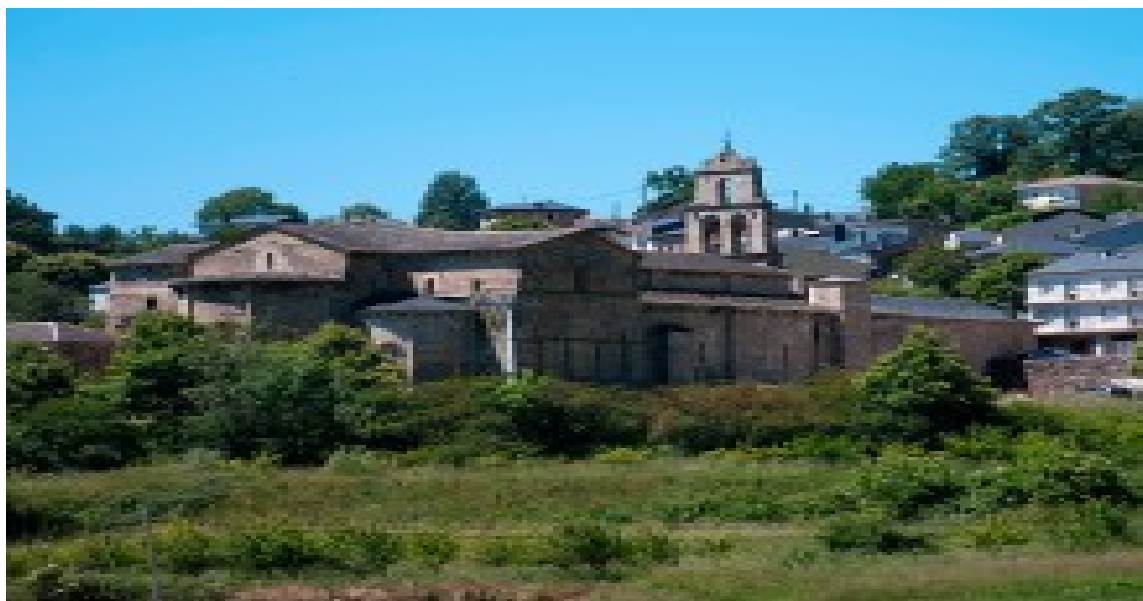
Monasterio de Santa María San Martín de Castañeda

Siglo XII Tal y como dijo Miguel de Unamuno: "San Martín de Castañeda, espejo de soledades, el lago recoge edades del antes del hombre y se queda soñando en la santa calma del cielo de las alturas en que se sume en honduras de anegarse, ¡pobre!